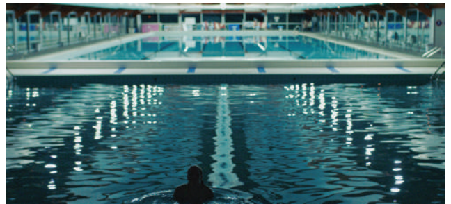
Les Sirènes du Chesnay