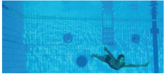
A la Piscine

Deux courts métrages de ce programme présentent la piscine. Comment la piscine est-elle représentée dans les deux films, sachant que l'un des films est un film de fiction et l'autre un documentaire ? On voit ci-contre des images des deux films qui mettent en valeur différemment la piscine. La première image, du premier court métrage du programme, représente la piscine comme espace de loisirs, de vacances, d'ennui, où la voix d'une femme qui pleure vient troubler l'atmosphère ludique. Le troisième film du programme quant à lui représente la piscine de façon plus sombre, plus angoissante : la voix off explique les compétitions, et on voit l'entraînement sans relâche. La piscine est ici un espace de travail, d'épuisement et non de relaxation.